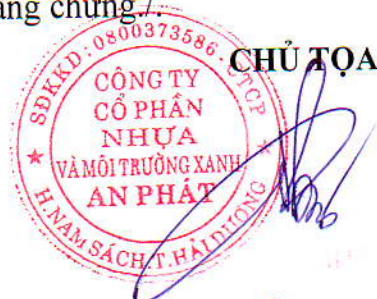
PHẠM ÁNH DƯƠNG